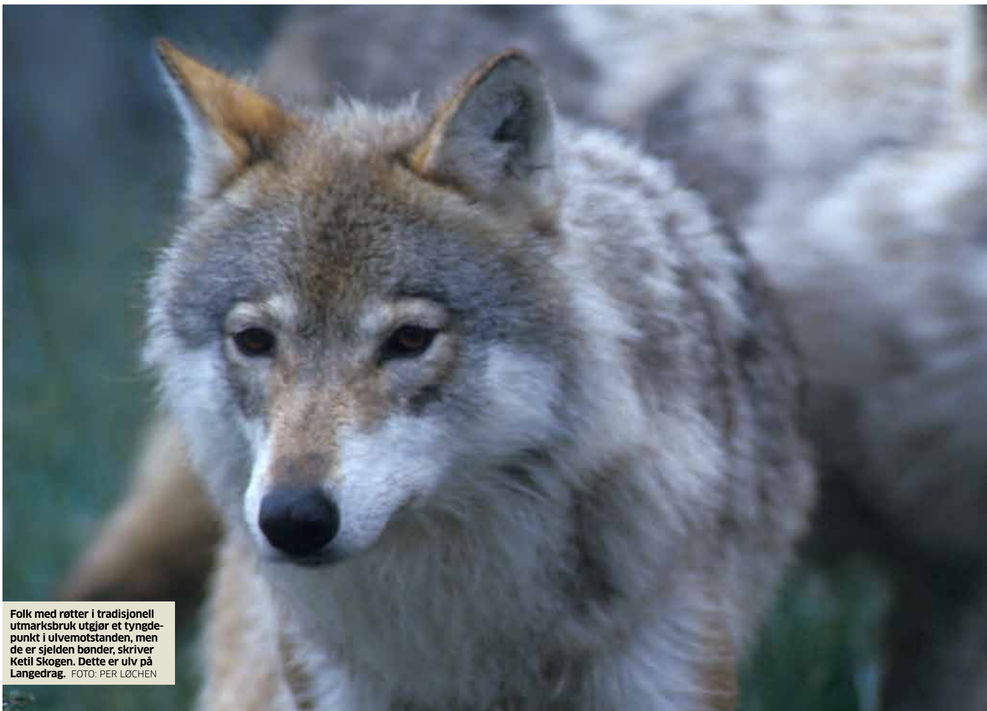
Folk med røtter i tradisjonell utmarksbruk utgjør et tyngdepunkt i ulvemotstanden, men de er sjelden bønder, skriver Ketil Skogen. Dette er ulv på Langedrag.

I ulveområdene ser vi en historisk ny koalisjon mellom en rural arbeiderklasse og skogeiere i en allianse mot urbane naturvernere.