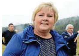
Får ros: Erna Solberg.

For en næring med store volumer er effektiv transport viktig, herunder også for eksport, som er en forutsetning for vår gjenværende industri. Ytterligere prioritering av skogsbilveier og tømmerkaier er derfor all grunn til å applaudere, på lik linje med forståelsen for at fylkesveinettet må prioriteres. Nåværende Regjeringen har gjennom flere år levert ved å øke veibeilgningene med 80% i forhold til forrige regjering. Derfor er det også bra at i hvert fall signalanlegget for jernbanen ved Vestmo er prioritert. Som største bruker av jernbane er ønskelisten lengre enn som så, men dette øker forventningene våre til NTP. Regjeringen viser med dette forståelse for situasjonen og at de har lyttet til skognæringen.