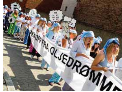
Demonstrasjonstog: Klimadebatten skaper engasjement.